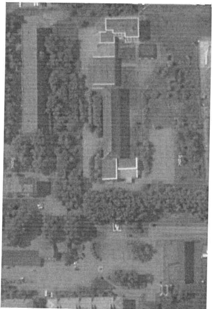
Рисунок 1 . Расположение образовательного учреждения ( вид сверху)